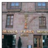
Hotel Salamanca Plaza del Mercado***