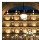
Hotel Petit Palace Las Torres***