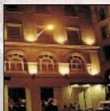
Hotel Husa Plaza del Ángel****