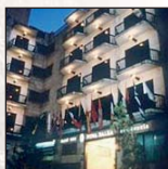
Hotel Silken Rona Dalba***