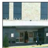
Hotel Vincci Ciudad de Salamanca****