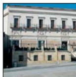
Hotel NH Palacio de Castellanos****