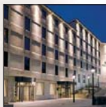
Hotel Melia Las Claras Boutique****