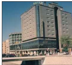
San Anton **** Prolongación San Antonio Granada