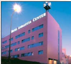
Andalucía Center **** Avenida América, s/n Granada