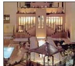
Saray **** Enrique Tierno Galván, 4 Granada