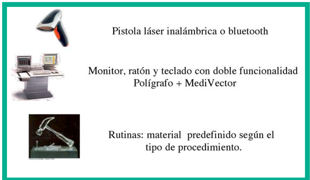
Figura 4. Sistema para almacén inteligente Medivector