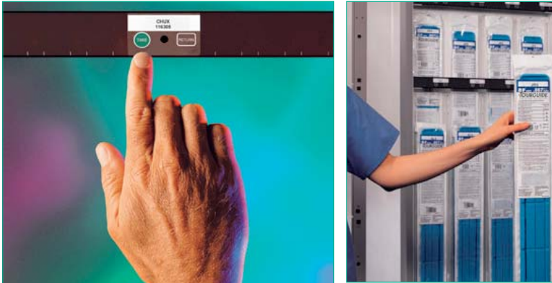
Figura 2. Sistema armarios con control por touch buttons

El sistema consta de una estación informática con sistema Windows NT con iconos, pantalla a color táctil y opciones según el código de acceso. Además incorpora una consola mediante la cual se puede realizar la gestión de material fungible para usuarios y pacientes, la gestión de pedidos y reposiciones, los boletines de aviso de roturas de stock y niveles críticos, el control de caducidades y el cálculo automático de punto de inventario óptimo.