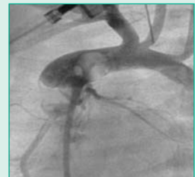
Fig.3. Inyección en raíz de aorta en OAI para visualización de distribución del árbol coronario con vistas a cirugía correctora de Jatene. El catéter viene de aurícula derecha a ventrículo derecho y cruza la válvula aórtica.