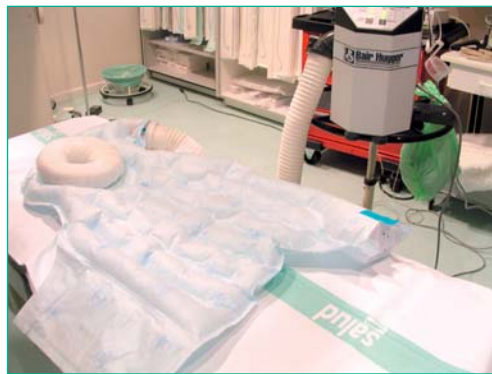
Figura 1. Fuente de calor