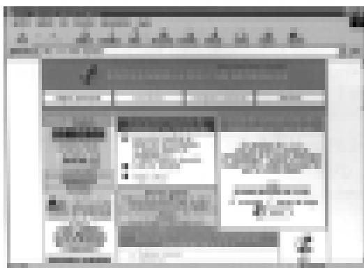
Página principal de la web Enfermería Cardiológica

Nuestro idioma nos permite ampliar nuestros horizontes, ya que gracias a él se pueden consultar fácilmente páginas de Enfermería españolas y de otros muchos países.