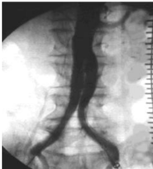
Prótesis ya fijada a la aorta abdominal Fig. 2