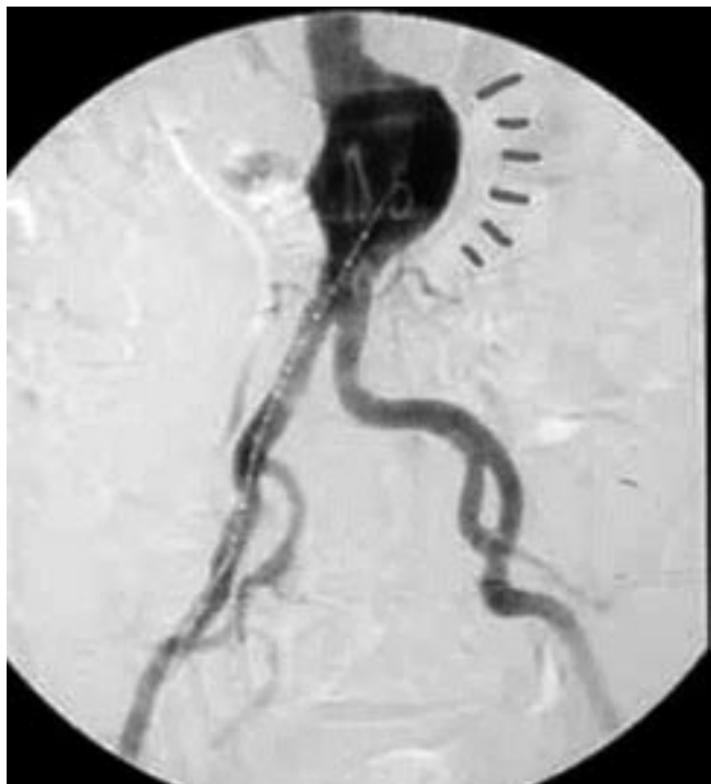
Aneurisma de aorta abdominal. Fig. 1

Agradecemos al Dr. Iván García, Médico Adjunto del Servicio de Cirugía Cardiovascular, así como al Servicio de Radiología del “Hospital Universitario Marqués de Valdecilla” y a todo el equipo de las unidades por su colaboración, ayuda y por la accesibilidad a la base de datos.