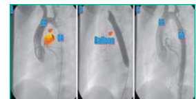
Fig 4: Tº de la coartación de aorta. A. Angiografía, B. Dilatación con balón. C. Angiografía de control.

En este momento se valora de nuevo mediante presiones y angiografía los resultados. Cuando los resultados son los deseados, se procede a la retirada del catéter balón bajo aspiración. (Fig 4).