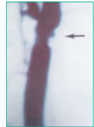
Figura 3. Diagnóstico angiográfico

Bajo sedación en niños y anestesia local en adultos, se realiza punción de la arteria femoral derecha, y colocación de introductor por el que se inserta una guía que atraviesa la estenosis, por la cual se avanza un catéter Pigtail o Multipropósito para obtención de gradientes de presión, y realización de ventriculografía izquierda y varias aortografías, para valoración anatómica y funcional. En algunos centros se coloca un introductor en arteria femoral izquierda, o braquial para valoración post dilatación. A continuación se introduce una guía larga en ventrículo izquierdo o subclavia derecha y se retira el catéter utilizado para la aortografía (7,8) .