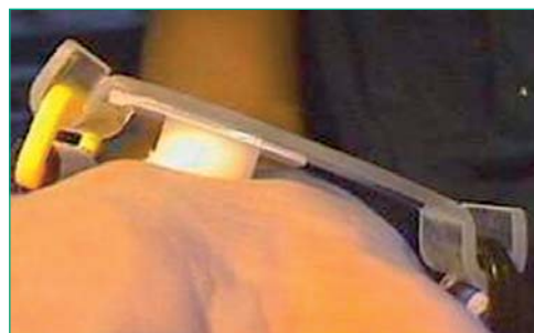
Figura 9. Adapty Stepty®P

Consiste en un parche de algodón y fibra no almohadillado de 15x27 mm. (9mm. de grosor) que se ajusta al punto de punción mediante pulsera elástica adhesiva de poliuretano de 40x120 mm. Tiempo de hemostasia: 6 horas. Una versión más completa es el Adapty Stepty®P (Figura 9) que añade una placa de plástico y una pulsera elástica con anillas de sujeción 15 .