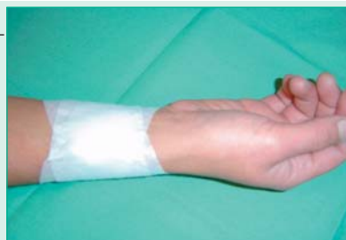
Figura 3. Apósito radial