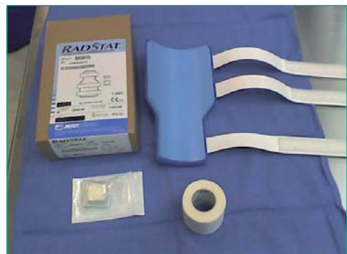
Figura 7. RadStat®