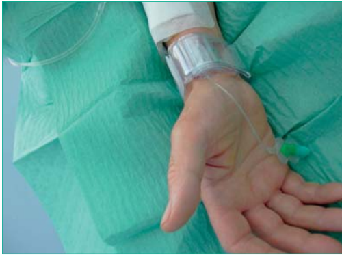
Figura 4. Tr-Band