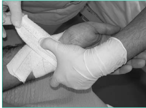
Figura 2. Colocación en cruz del vendaje