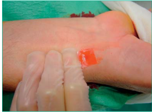
Figura 5. Syvek-Pach

tiempos medios de hemostasia son 114 \pm 64 min. en 4F y 5F y 223 \pm 64 min en 6F. Su incidencia de complicaciones locales de 15% está lejos de la seguridad y eficacia de otros dispositivos de hemostasia radial 13 . (Figura 6)