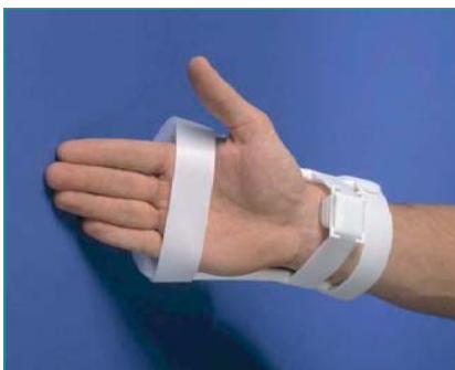
Figura 6. RadiStop®

Es un vendaje hemostático compuesto de una banda de plástico ajustable en la muñeca que incorpora en la almohadilla la emulsión hemostática D-Stat® (trombina). Actúa sobre la cascada de coagulación y estimula la agregación plaquetaria. Está contraindicado en personas con sensibilidad a derivados bovinos. Tiempo de hemostasia: 6-15 minutos.