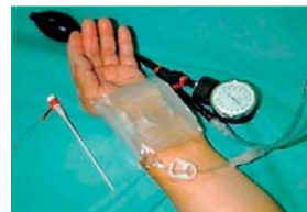
Figura 8. Tometakun®

Dispositivo similar al TRband® que consta de un manómetro para el control de la presión ejercida sobre el punto de punción. Como todos los dispositivos de compresión selectiva en la arteria puncionada, no comprimen las arterias radial/cubital de forma simultánea, por lo que se evita la isquemia de la mano y sus derivadas consecuencias (molestia, dolor, hormigueo...) 14 . (Figura 8)